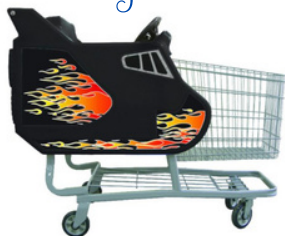
OPTION #1 PRÉSENTÉ

Les chariots pour enfant offrent une expérience ludique, vous donnant ainsi un avantage concurrentiel & optimisant l'expérience d'achat pour toute la famille !